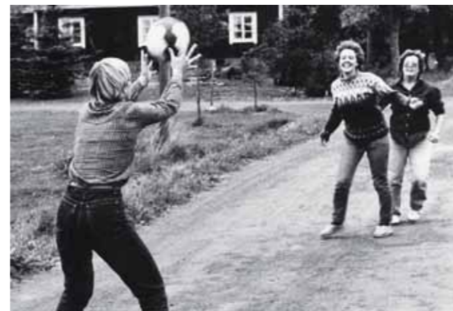
Bollspel av olika slag har alltid hört till ungdomens fritissysselsättningar.