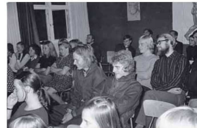
Samkvämskvällarna bjöd på underhållning med filmförevisningar, lekar och annat program.