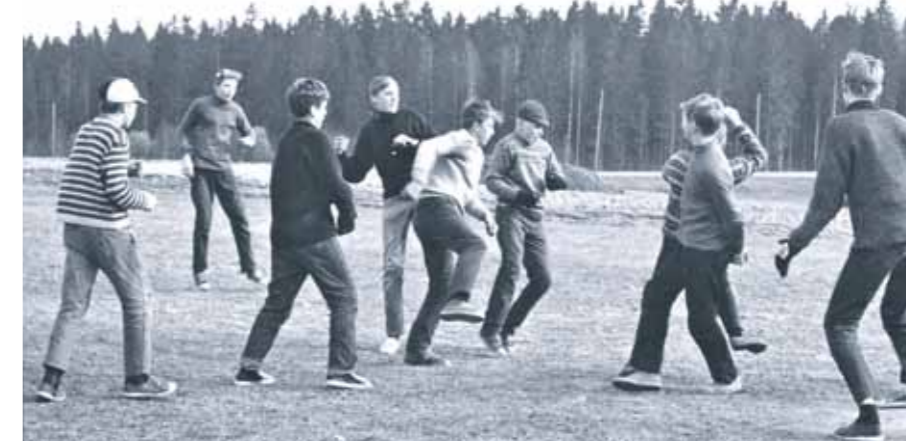
Fotbollsspelande pojkar på gräsplanen, en vanlig syn vid Överby skola för landsbygdsens yrken, om bara vädret var gynnsamt.